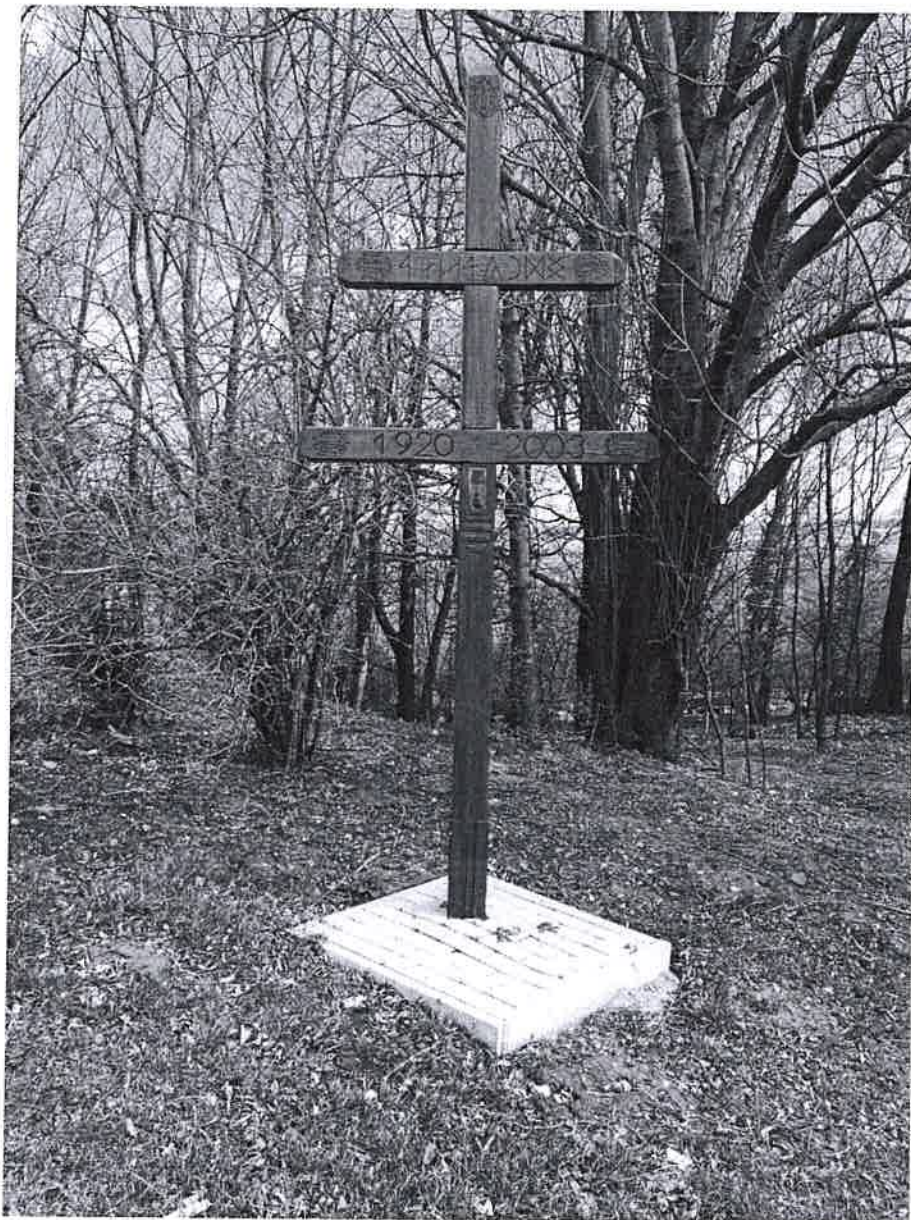
1. ábra Trianon emlékmű