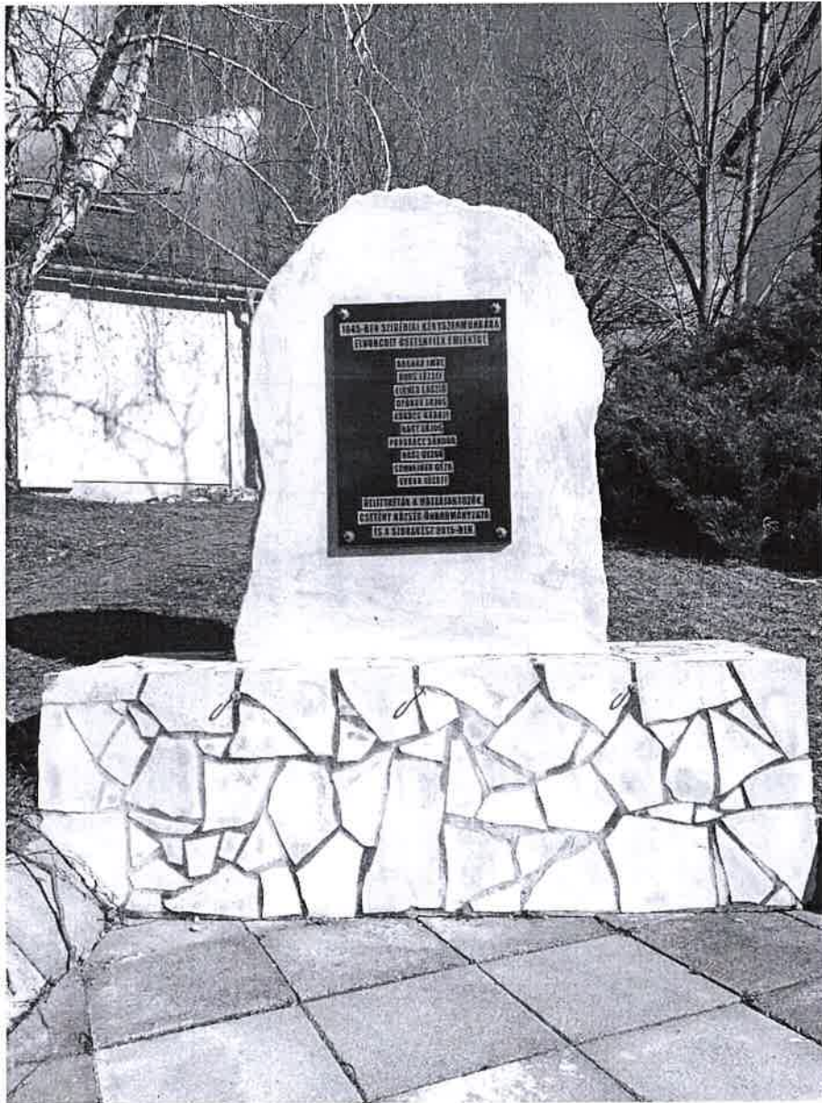
1. ábra Malenkij robot emlékmű